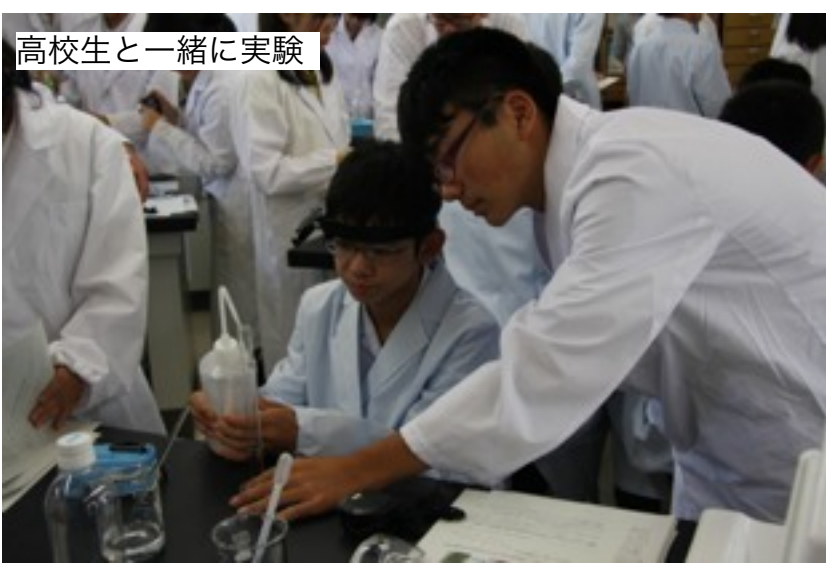
高校生と一緒に実験