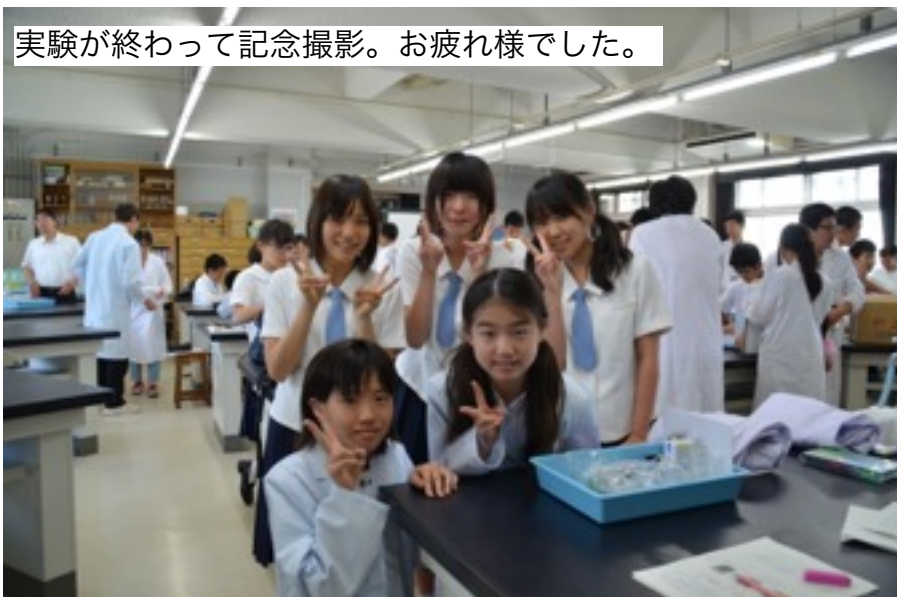
実験が終わって記念撮影。お疲れ様でした。

アシスタントのみなさんは午前午後合わせて7時間以上の活動でした。お疲れ様でした。