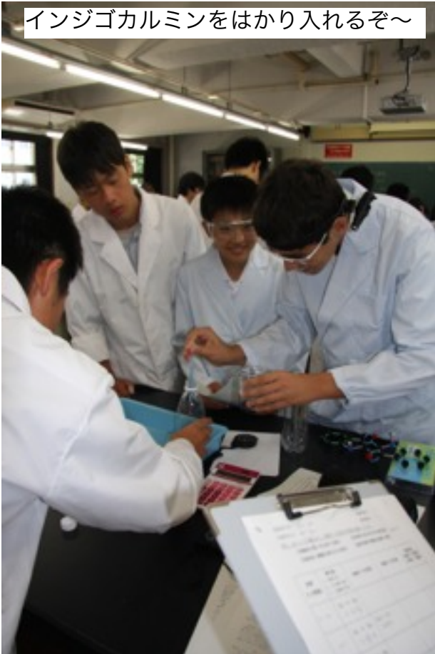
インジゴカルミンをはかり入れるぞ～